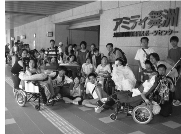
みんなでお出かけ