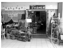
尼崎市武庫之荘の パリ雑貨店「ジャム・ルガ」